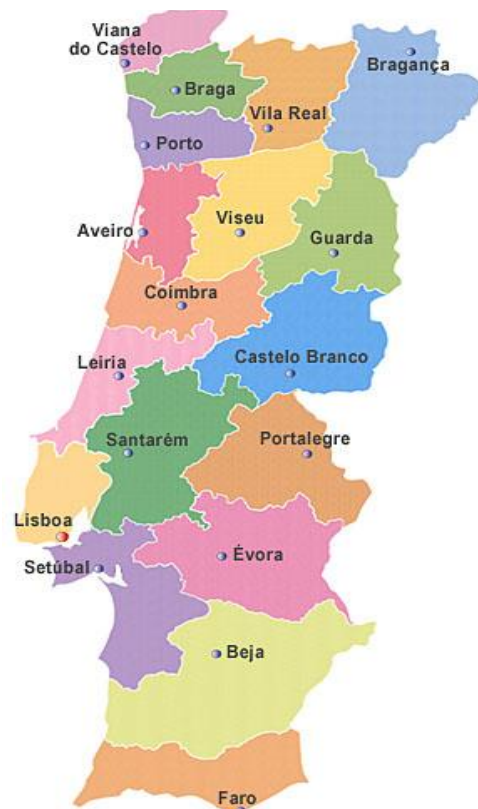
Mapa de Portugal